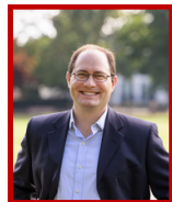
Prefeito Dominick Pangallo Presidente

Dissolução do Comitê de Seleção do Superintendente